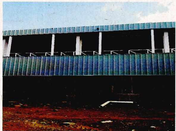
Fotografía N° 8 - 8/2/17: Falta instalación de bajada de aguas lluvias.