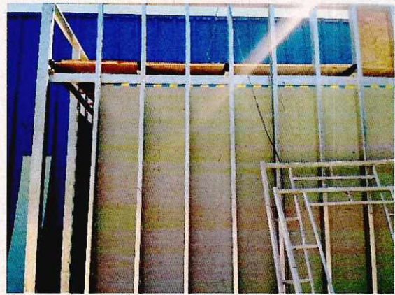
Fotografía N° 6 - 24/1/17: Tabiquería en ejecución.